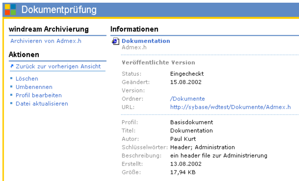
Abb.: Ansicht der Informationen zu einem windream-Dokument im SharePoint Portal Server

Die folgende Abbildung illustriert die Anzeige eines windream-Dokuments im Microsoft SharePoint Portal Server: